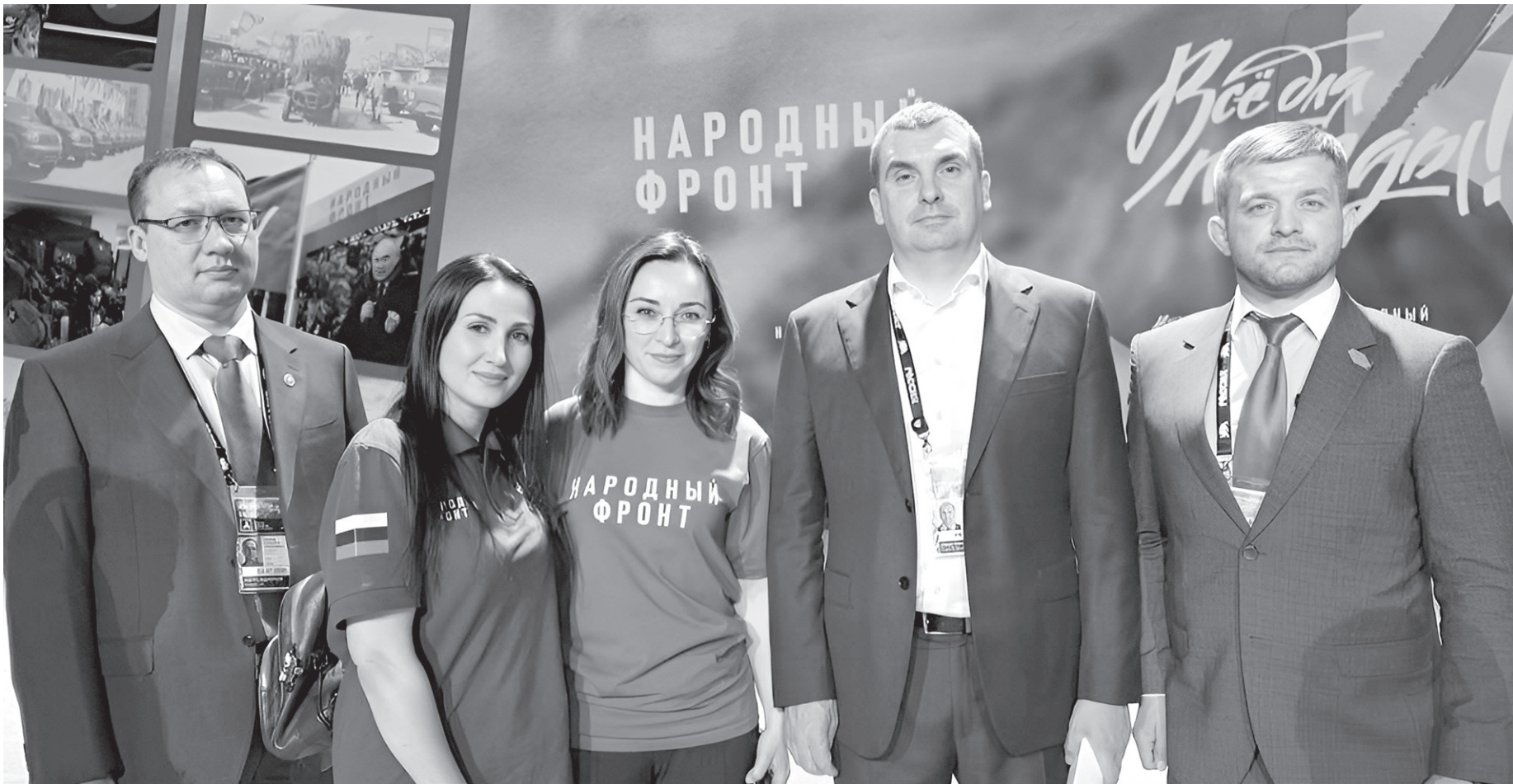
Участники форума Общероссийского Народного фронта

Ну, а запомнилось, конечно, больше всего выступление нашего Президента Владимира Владимировича Путина. Он очень высоко оценил работу нашей общественной организации и отметил, что за три года, которые прошли с начала реализации проекта «Всё для Победы!», на поддержку специальной военной операции было собрано 54,5 миллиарда рублей народных средств. Это позволило дополнительно поставить на фронт необходимое оборудование, технику, квадрокоптеры, аптечки, а также более 14 тысяч