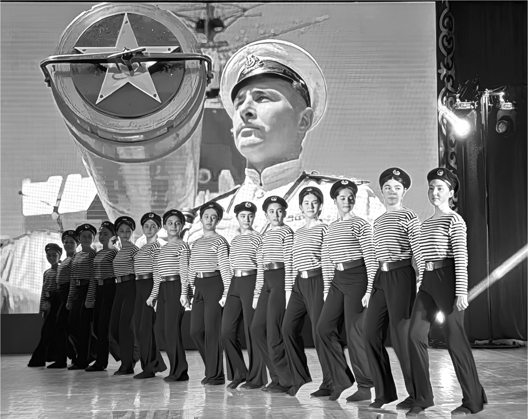
Хореографический ансамбль «Азат» — постоянный победитель Международного конкурса «Жемчужина Черноморья»

А когда на экране появляются войны, идущие на фронт, на сцену выходят солисты отдела куль-