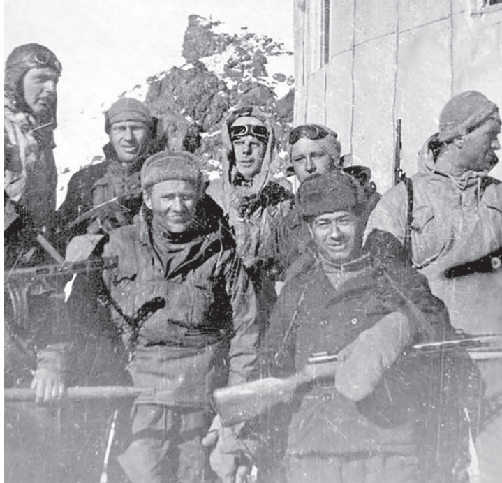
Участники битвы за Эльбрус. 1943 год

организаторами мероприятия выступают: Правительство КЧР и КБР, администрация Зеленчукского района, ООД «Поиское движение России», Министерство обороны РФ, Погранничное управление ФСБ России по Карачаево-Черкесской Республике, ПАО «Лукойл», ПФ «Берег», Ассоциация ветеранов СВО Республики Башкортостан, Фонд президентских грантов.