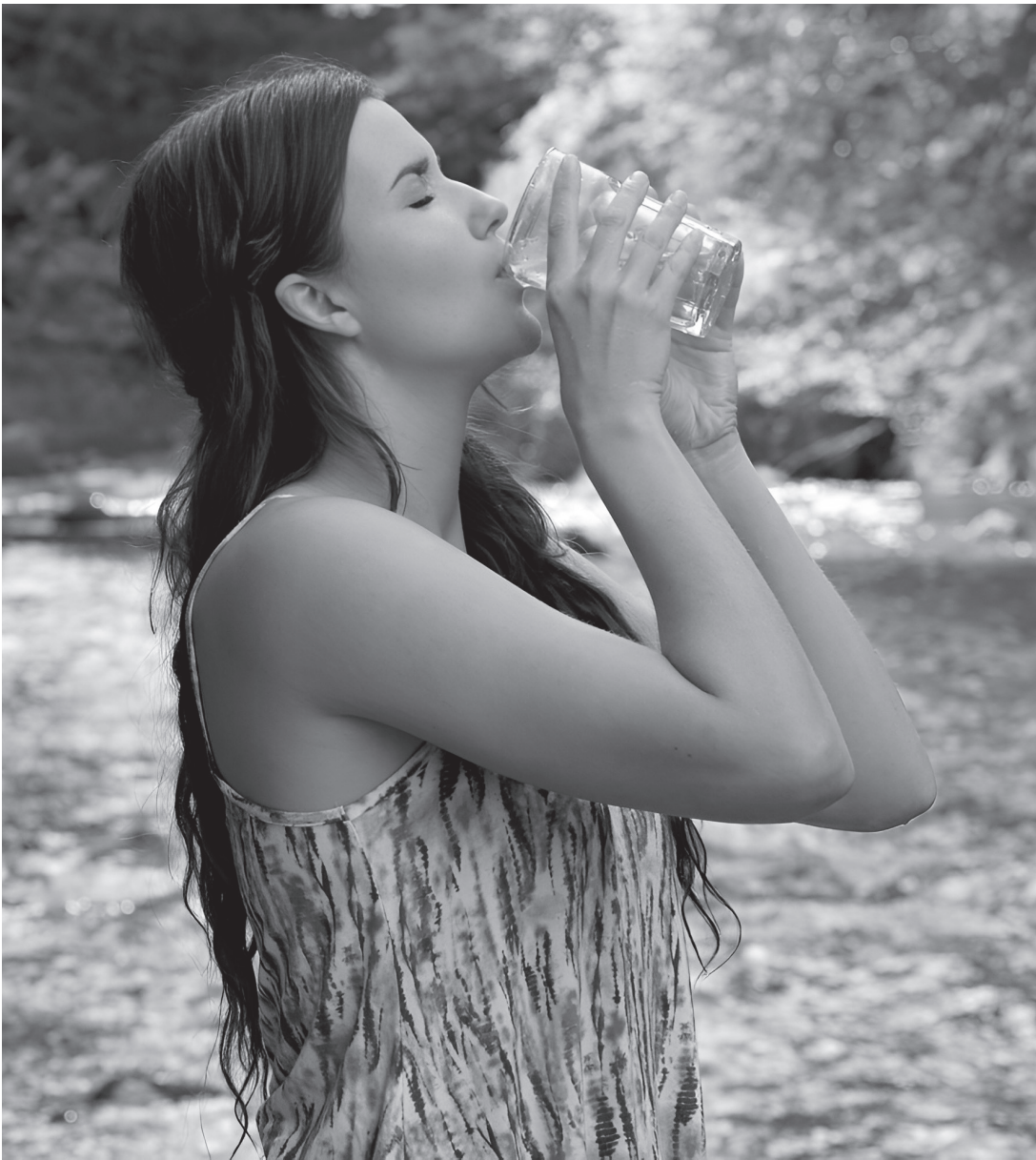
Взрослому человеку необходимо выпивать не менее полутора литров воды в день

В свою очередь, полноценное питание, включающее источники глюкозы, омега-3, витаминов, магния, селена и цинка, обеспечивает правильное функционирование мозга, так как все эти элементы вовлечены в метаболизм организма, помогают адаптации человека к стрессу и позитивно воздействуют на интеллект, способствуя улучшению работы мозга, повышению настроения и когнитивных способностей. Замените фастфуд на фрукты и овощи, добавьте орехи и рыбу в свой рацион, и ваш мозг будет вам благодарен. Кстати, по исследованиям ученых качество питания в среднем возрасте напрямую связано со структурой и объемом мозга.